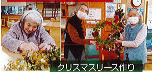
クリスマスリース作り