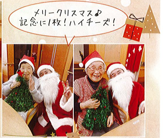
メリークリスマス♪ 記念に1枚!ハイチーズ!