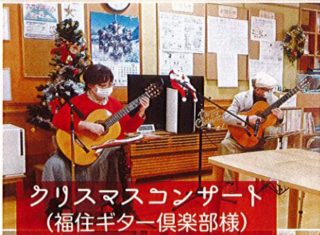
クリスマスコンサート (福住ギター倶楽部様)