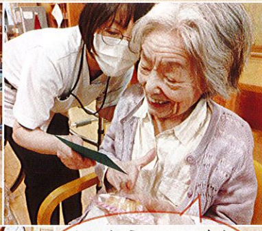
サンタクロースから 年紙をもらったよ!