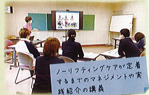
ノーリフティングケアが定着するまでのマネジメントや実践紹介の講義