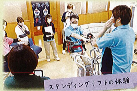
スタンディングリフトの体験

老健てらどまりのノーリフティングケアの取り組みが認められ、全国老人保健施設協会の実地研修の1つである「ノーリフティングケア～腰痛予防対策～」を当施設が担当しています。