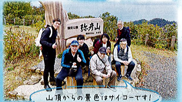
山頂からの景色はサイコーです!

通所リハビリテーションで 日々リハビリに励まれている ご利用者と職員がその効果を 楽しみながら体感できる弥彦 ハイキングを行いました。