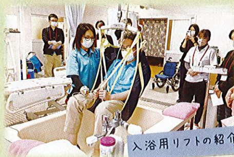
入浴用リフトの紹介