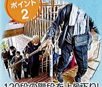
120段の階段を上り下り!