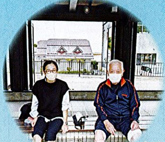
足湯と美味しい食事で疲れを癒しました。