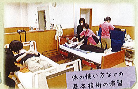
体の使い方などの基本技術の演習