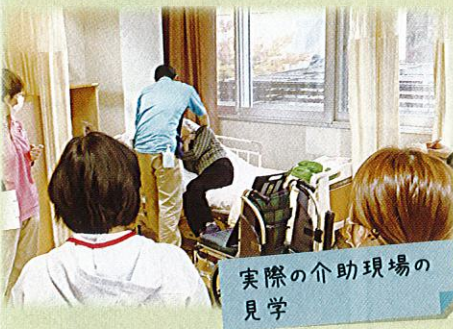
実際の介助現場の見学