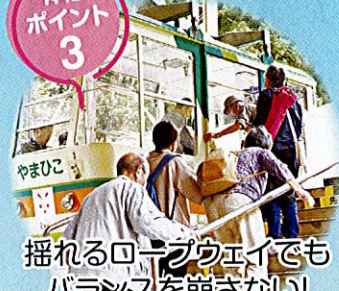
揺れるロープウェイでも バランスを崩さない!