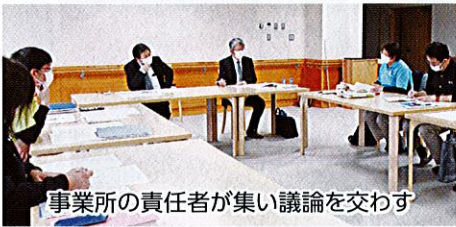
事業所の責任者が集い議論を交わす

令和6年度からは法人内事業所の見学機会を定例化し、互いの事業所のありのままに触れ、業務の最適化を図るとともに幅広い視野を持つ職員の育成に努めます。