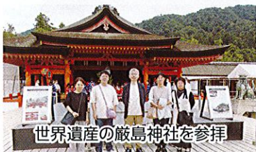
世界遺産の厳島神社を参拝

令和7年度の全国大会は兵庫県で行われます。私たちの実践を、これまでの実績をさらに深めて全国に向けて発信していきたいと思ひます。