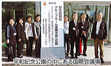
平和記念公園の中にある国際会議場

法人からの発表は4題、早くから抄録原稿の取りまとめを進めました。パワーポイントやポスター制作にも工夫を凝らし、オリジナルの実践を全国に向けて発表してきました。