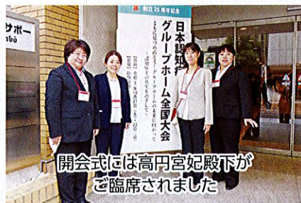
開会式には高円宮妃殿下がご臨席されました