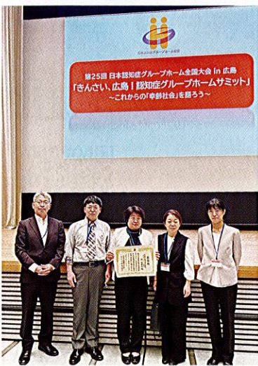
翌年の全国大会(広島)において、演題表彰として奨励賞をいただきました(表彰式にて撮影)

この大会では、部会で取り組んだ研修活動の演題は発表内容が優れていたとして「奨励賞」を受賞しました。心より感謝申し上げますとともに、この榮譽を糧としてさらなるステップアップを目指してまいります。