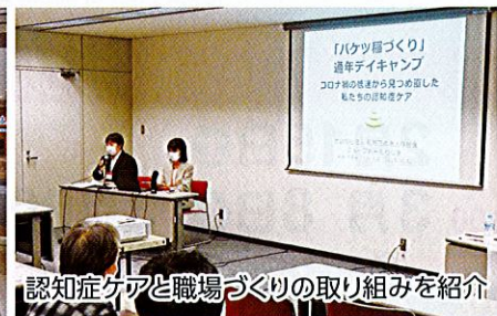
認知症ケアと職場づくりの取り組みを紹介