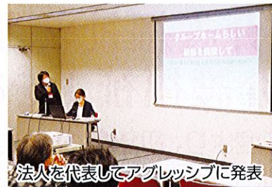
法人を代表してアブレッシブに発表

「ともに見つめ直そう！グループホームの未来に向かって〜認知症との共生をめざして〜」を大会テーマに、全国からグループホームケアを実践する仲間が集まりました。