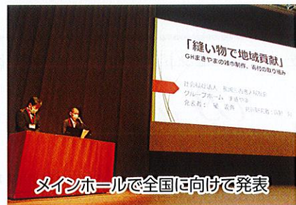
メインホールで全国に向けて発表

全国から1,200人を超える仲間が広島市・広島国際会議場に集い、「認知症グループホームサミット」これからの年齢社会を語ろう」をテーマに語り合いました。