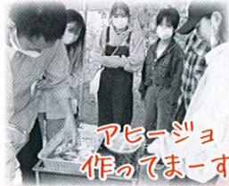
アヒージョ 作ってまーす