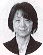
長岡介護福祉 専門学校あゆみ