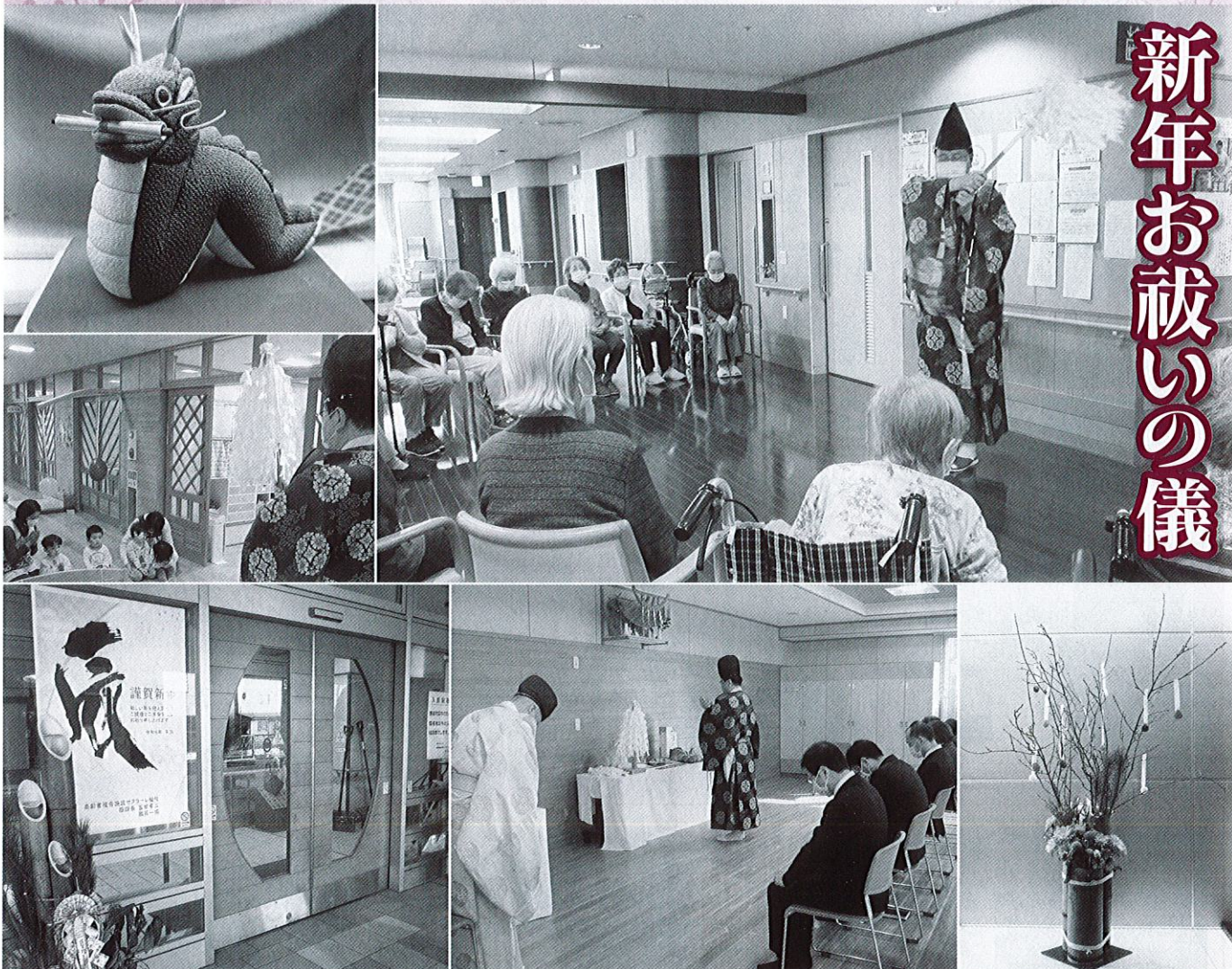
蒼柴神社様よりお越しいただきました